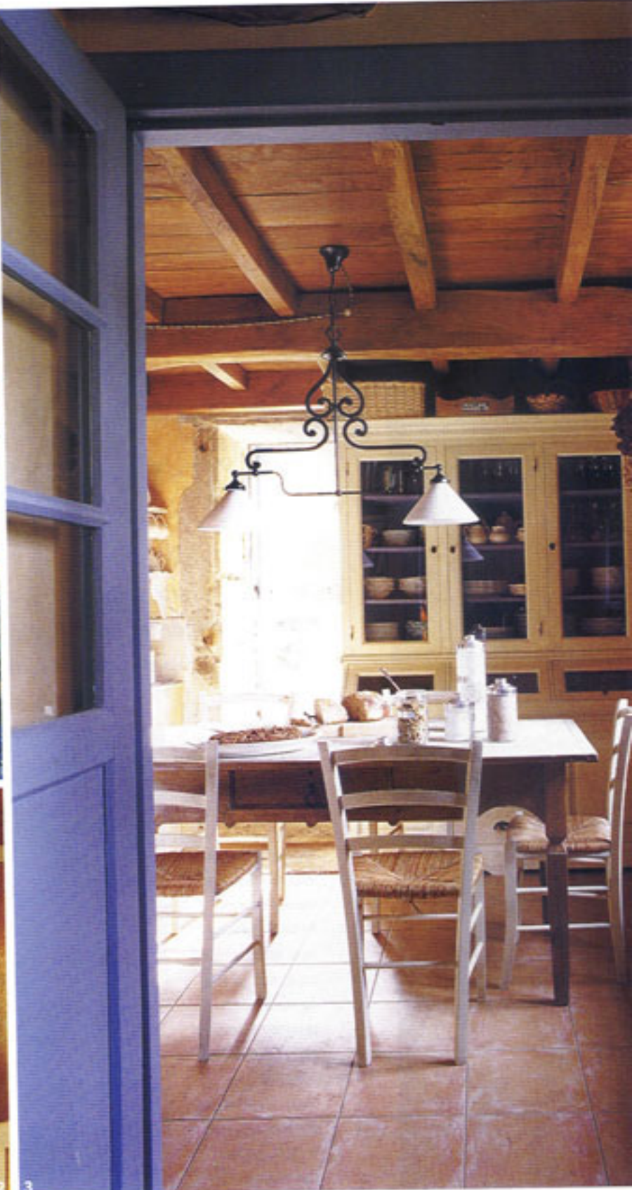
1. FACHADA: acabada con mortero de cal hidráulica y pintada a la cal con pigmentos naturales, por Anabel Alegre. La carpintería de puertas y ventanas es de castaño y teca, pintada de azul, obra de Carpintería Cendán. 2. MENAJE: de loza, para el desayuno, de La Esmeralda. 3. COCINA: con suelo de barro y techo de vigas vistas, la mesa y las sillas son antiguas y la vitrina, de Antigüedades Potes.