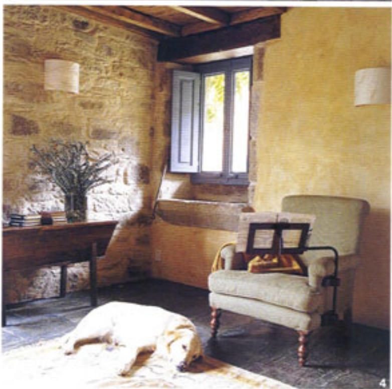
1. DORMITORIO: Aire, con muebles de Antigüedades Potes. 2. BAÑO: mueble diseño del propietario, realizado por Antigüedades Potes, Grifería de Cristina y toallas de Casa Alvarinho. 3. HABITACIÓN: Alba, pintada con pigmentos naturales. Muebles de Antigüedades Potes. 4. RINCÓN: de lectura, con butaca de Muebles Placer.