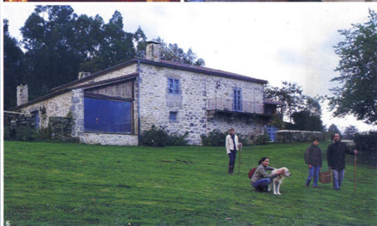
4. VELAS: un armario antiguo, de Antigüedades Potes, con puertas recuperadas de un balcón, expone las velas de canela, vainilla y miel con las que se perfuma el hotel. Están a la venta y valen entre 2 y 18 €. 5. SALÓN: con chimenea, los sillones son de Muebles Placer y los arcones son antiguos. 6. EXTERIOR: Alberto, propietario del hotel, junto a sus hijos y Eugenia, recogiendo castañas y leña.